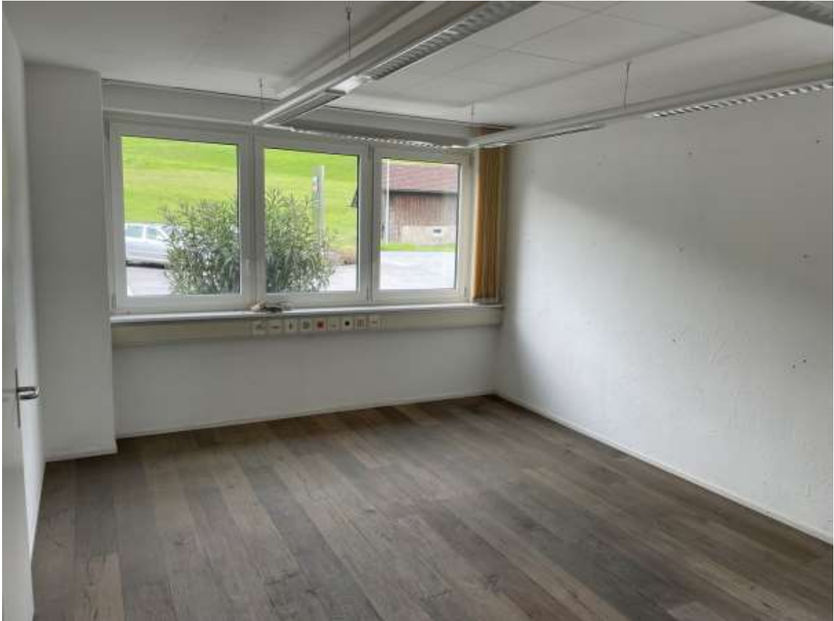
Eck-Büro Nord mit direktem Zugang. Eichenholzboden