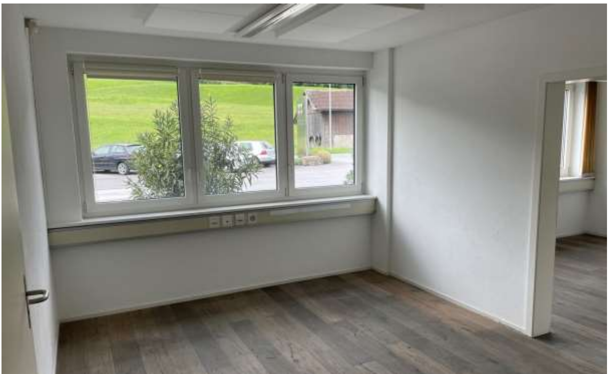
Büro mit direktem Zugang. Eichenholzboden