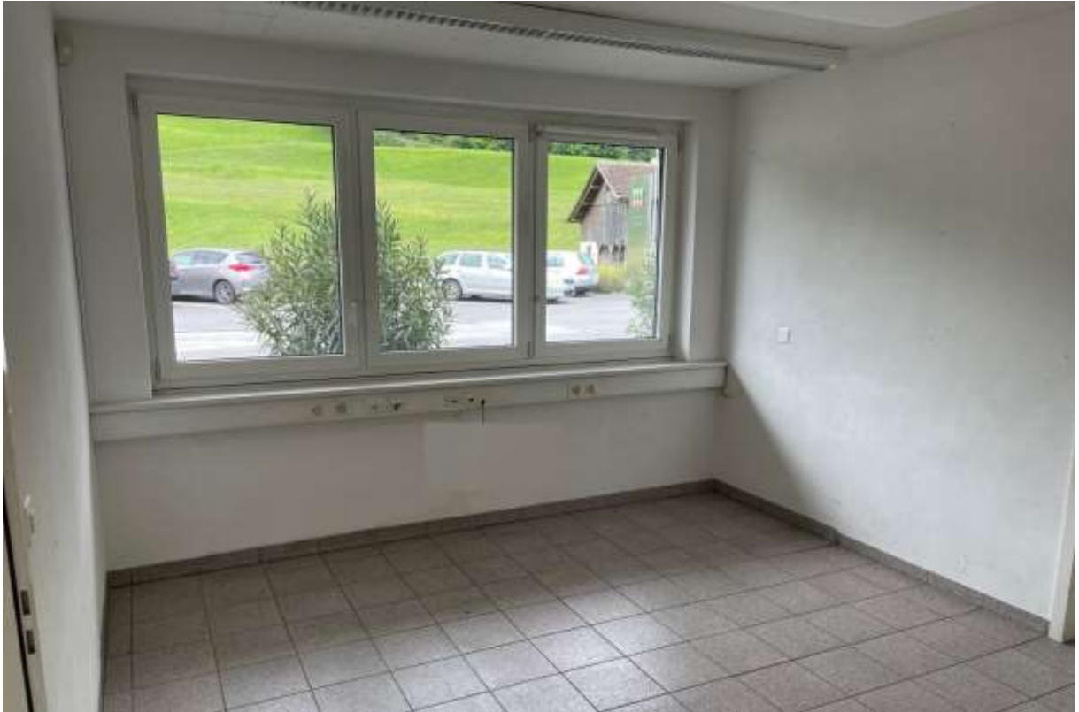
Büro mit direktem Zugang. Fliesenboden